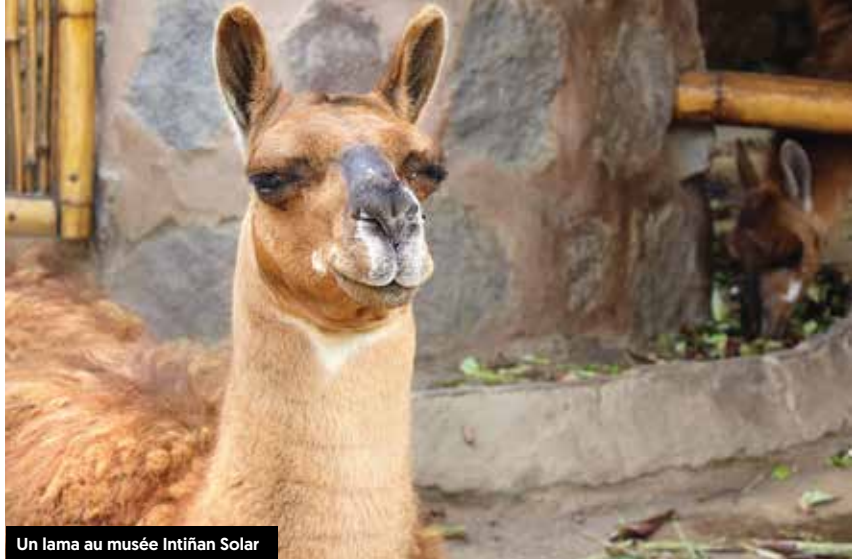
Un lama au musée Intifian Solar

« Je ne crois pas que je sois tout à fait prêt à me soumettre aux effets psychédéliques des fougères andines », lui ai-je répondu à la blague. « Pas de problème mon ami, m'a-t-il répliqué. Quand tu reviendras en Équateur pour y goûter, je serai là ! » ●