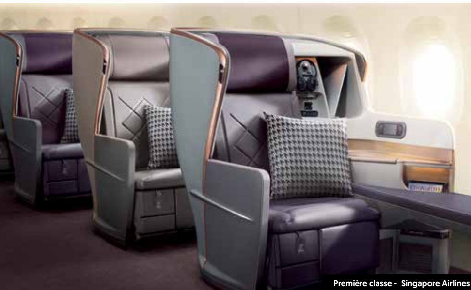
Première classe - Singapore Airlines

Les appareils sont dotés de fenêtres plus grandes, d'éclairages de cabine spécifiques et d'un fuselage plus large pouvant contribuer à réduire le décalage horaire.