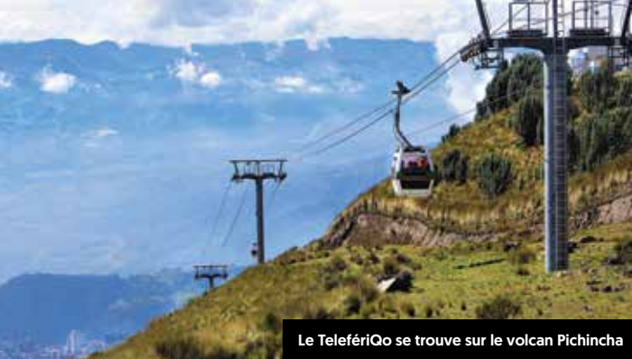
Le TelefériQo se trouve sur le volcan Pichincha