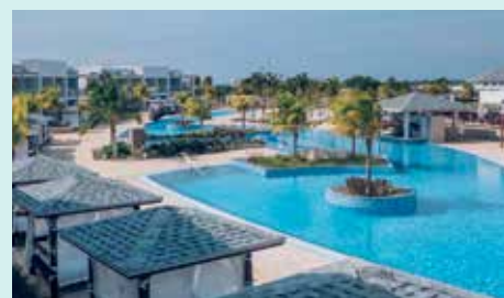
CORAL LEVEL AT IBEROSTAR SELECTION HOLGUÍN ★ ★ ★ ★ ★

Vous vous réveillez le matin et le rêve se poursuit. Face à vous, les plages vous attendent pour vous dévoiler leurs secrets : laissez-vous émerveiller par la couleur de l'eau et par les récifs coralliens, qui figurent parmi les plus importants au monde.