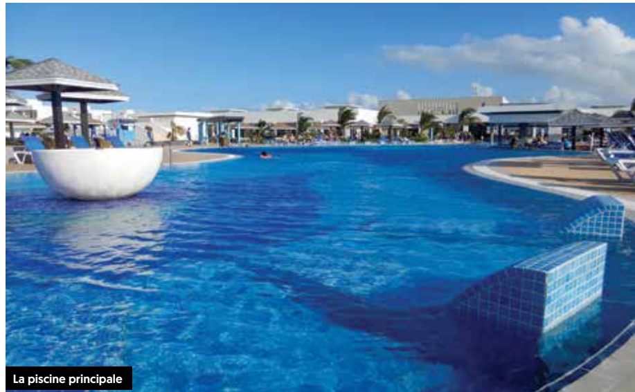
La piscine principale