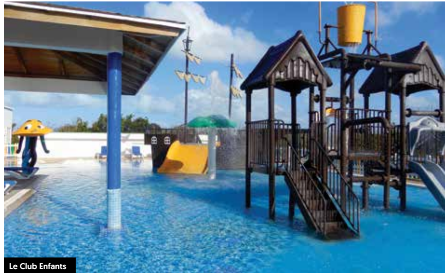
Le Club Enfants

N iché dans les cayos de l'archipel préservé de Jardines del Rey, ce complexe aux lignes graciles ne pouvait trouver meilleur écrin. Chic et épuré, il ravira les amateurs de design contemporain tout comme les familles en quête d'un petit quelque chose de nouveau.