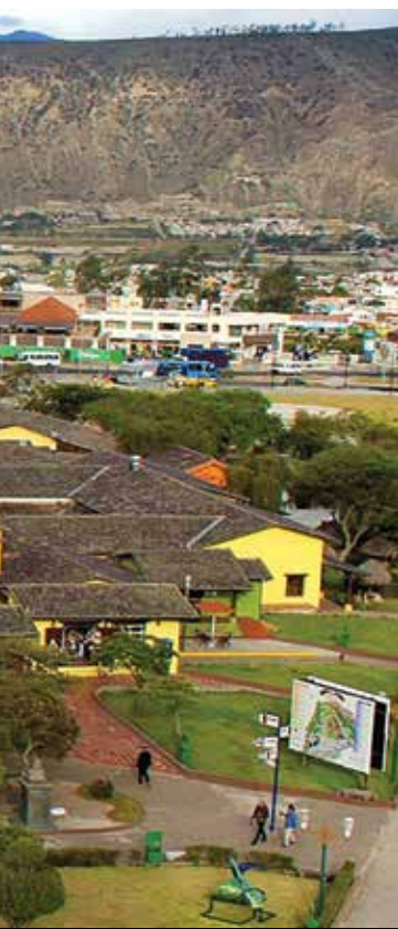
Vue des sommets - Ciudad Mitad del Mundo