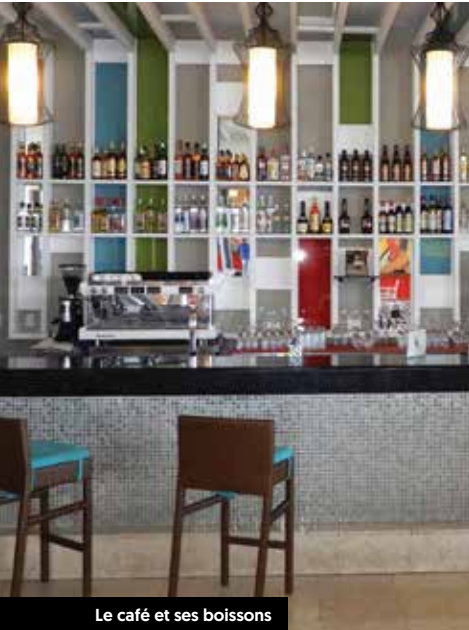
Le café et ses boissons