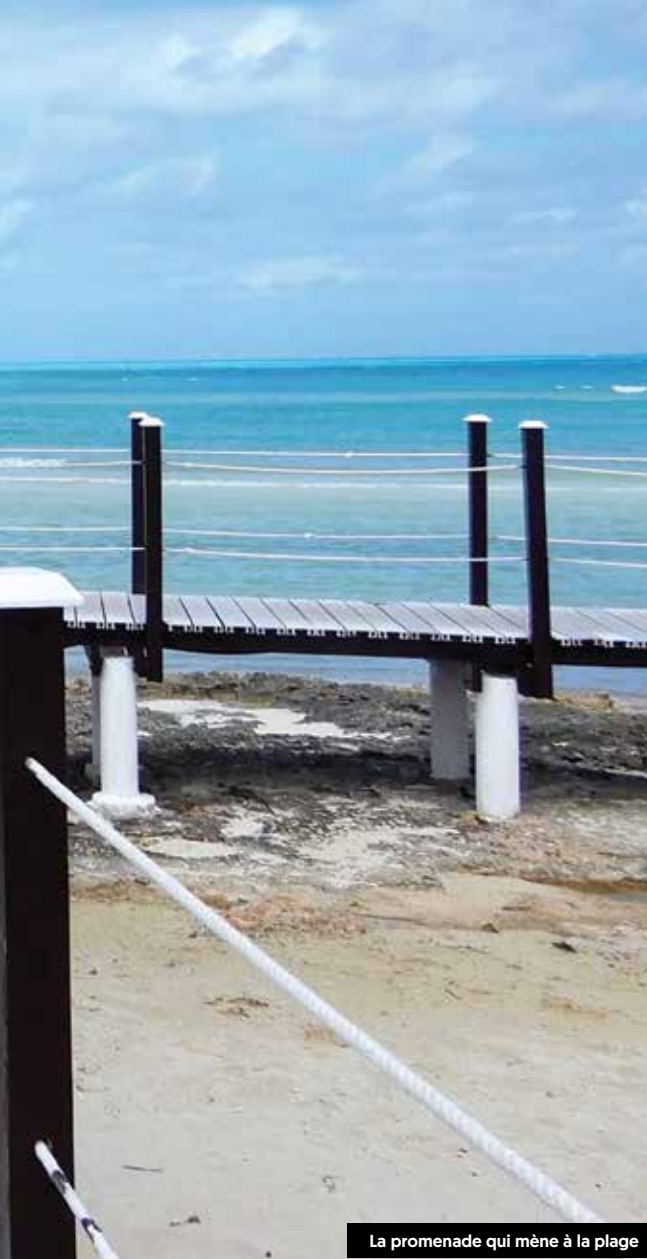
La promenade qui mène à la plage