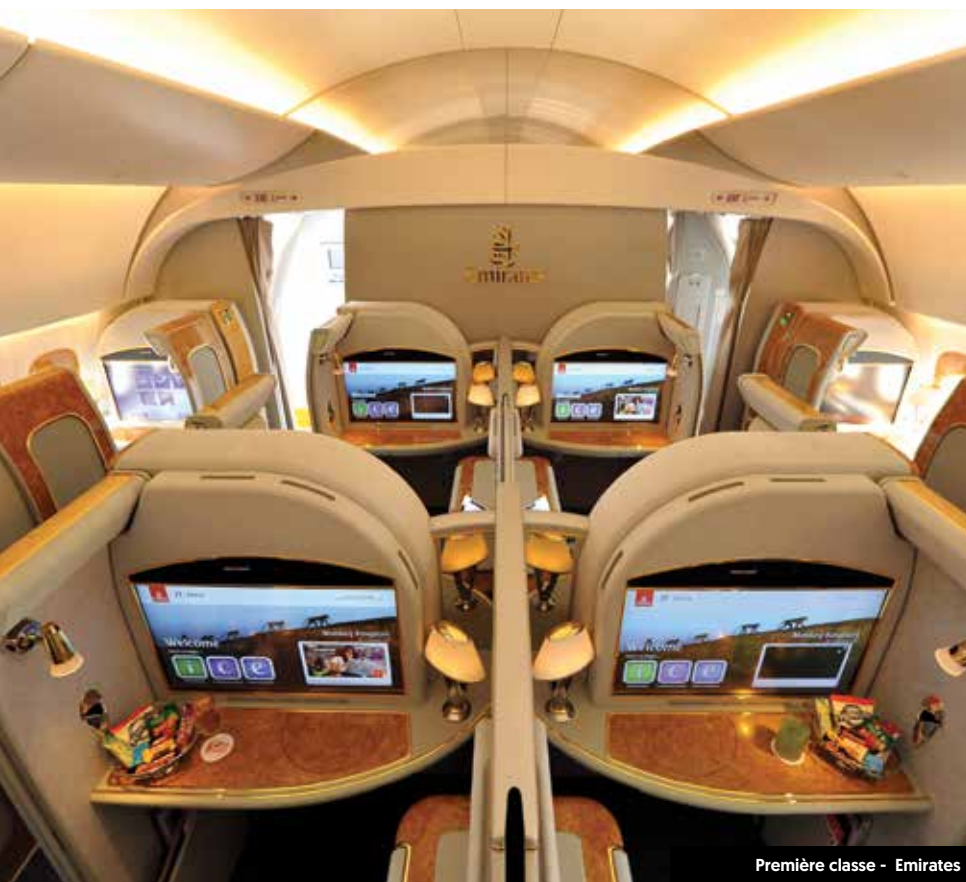
Première classe - Emirates