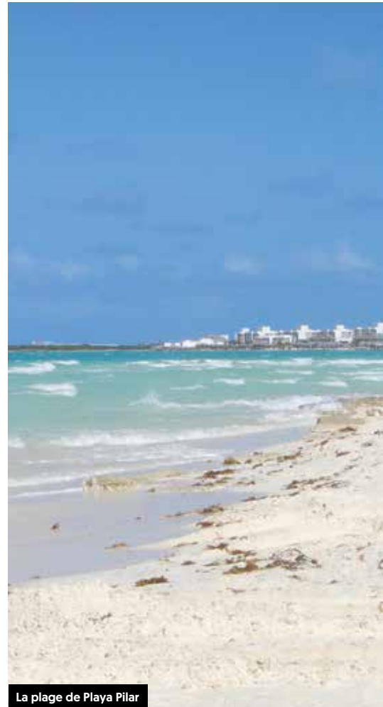
La plage de Playa Pilar