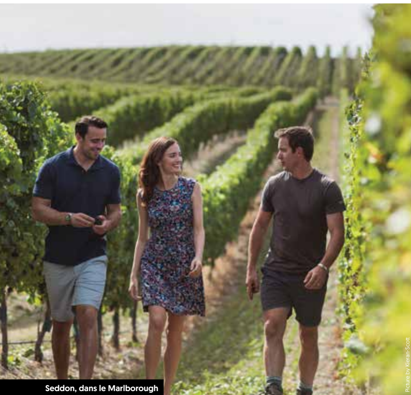
Seddon, dans le Marlborough