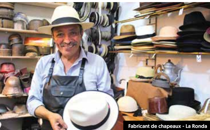
Fabricant de chapeaux - La Ronda

Selon mon guide, un voyage en Équateur ne serait pas complet sans l'incontournable photo sur la ligne imaginaire qui sépare les hémisphères sud et nord, à zéro degré de latitude. C'est donc en compagnie de douzaines d'autres touristes que j'ai, moi aussi, feint d'empoigner le globe métallique pour immortaliser ma présence à la Ciudad Mitad del Mundo. Ce monument commémore la découverte du parallèle médian de notre planète par un scientifique français au 18 e siècle.