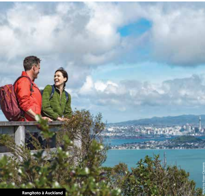
Rangitoto à Auckland