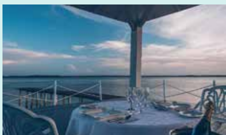
CORAL LEVEL AT IBEROSTAR SELECTION ENSENACHOS ★ ★ ★ ★ ★