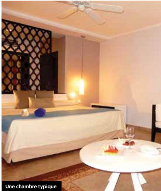
Une chambre typique