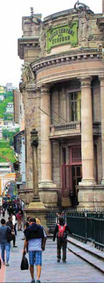
La vieille ville de Quito